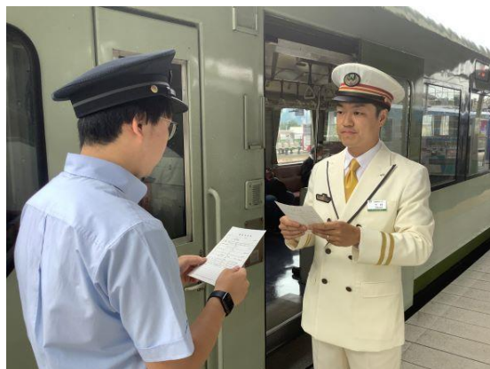
【運転通告券模擬交付】

※「運転通告券」とは・・・駅社員から直接乗務員に対して、運転方法等を通告するために用いられます。一例として、列車の運転時刻の変更、雨や風などによる速度規制、信号機が故障した際の運転方法などの通告があります。