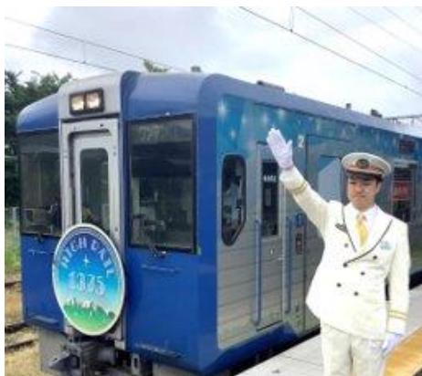
【HIGH RAIL 1375 出発式】