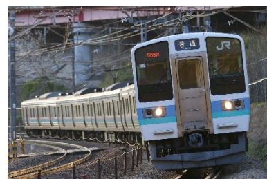
【中央本線を走行する211系】