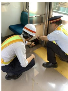
【非常用ドアコック扱い体験】