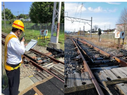
【ポイント転換体験】

普段は見る事ができない小淵沢駅の裏側まで潜入することができます。通常ではお客さまが乗車できない線路まで行き、時間の許す限り211系車両を現役乗務員と共に車内放送や非常用ドアコック扱いを体験!!是非この機会にプログラムを体験しにきませんか。