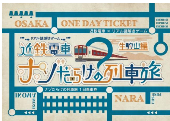
オリジナルデザイン1日乗車券