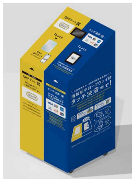
専用端末（イメージ）

小田急箱根グループでは、タッチ決済と QR チケットで周遊観光の環境整備を推進してまいります。なお、ロープウェイに国際ブランドのタッチ決済を導入するのは、全国初の取り組みです。