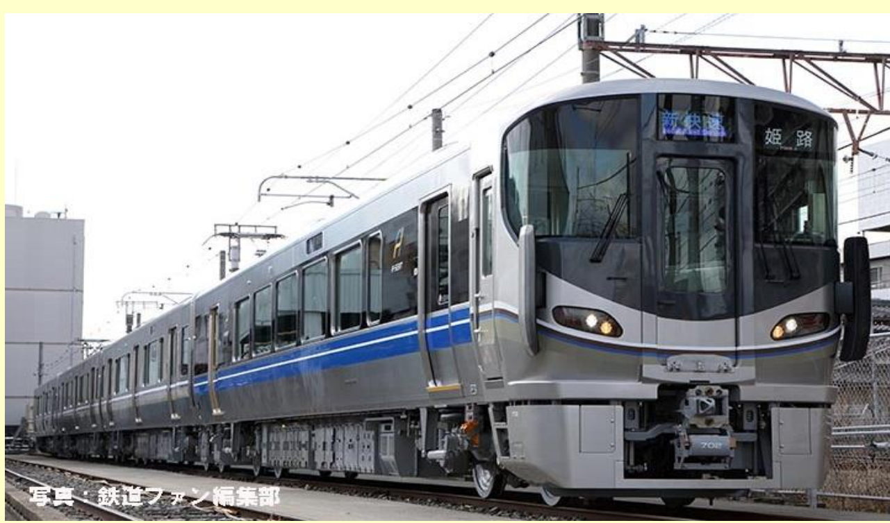
写真・鉄道ファン編集部