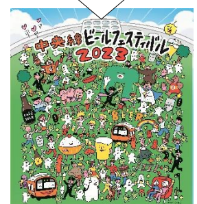
ビジュアルも年々よりにぎやかに！