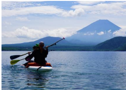
千円富士を背景に本栖湖でカヌー体験(身延町)