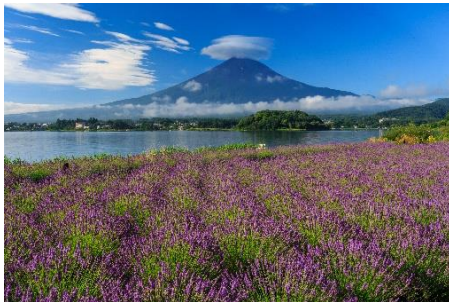
ハーブフェスティバル(富士河口湖町)

観光PRブースでは、山梨県のお出かけ情報などをご提供します。夏のご旅行先に、是非魅力あ られる山梨をご検討ください。