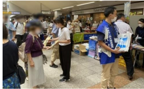
パンフレット配布・観光PR