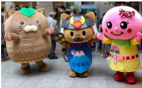
ご当地キャラクターによる観光PR

7月6日(木) 甲斐市(やはたいぬ)、甲州市(モモンちゃん)、甲府市、都留市(つるビー)、 富士河口湖町(ふじぴょん)、身延町(みのワン)、山中湖村