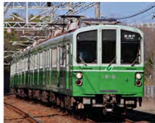
今年引退を迎える1000形(18号車)