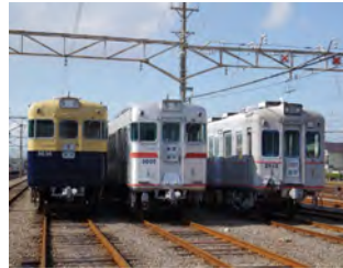
ご覧いただく予定の車両