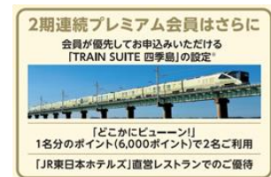
(2期連続プレミアム特典例)