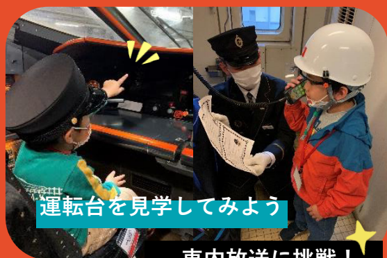
運転台を見学してみよう