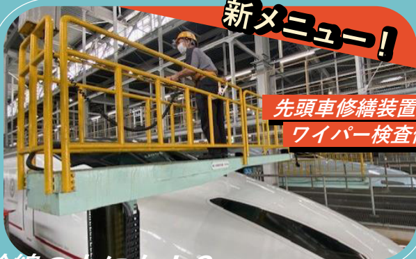
先頭車修繕装置で ワイパー検査体験