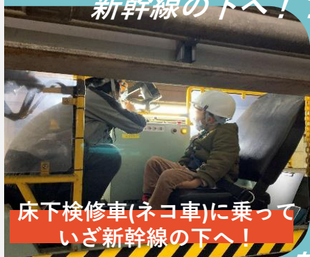
床下検修車(ネコ車)に乗って いざ新幹線の下へ!