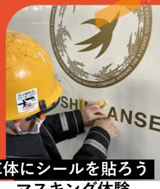
車体にシールを貼ろう マスキング体験