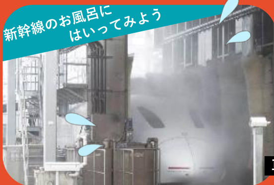
新幹線のお風呂に はいつてみよう