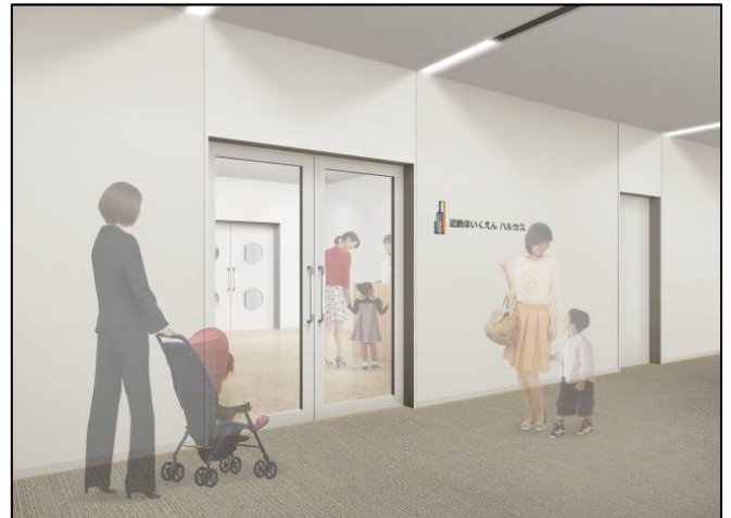
イメージパース（左：保育室内、右：エントランス）