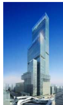
「あべのハルカス」完成後イメージ