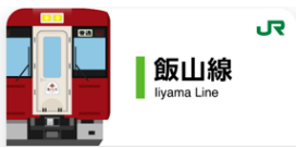
飯山線スタンプ帳ラベル