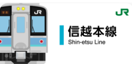
信越本線スタンプ帳ラベル