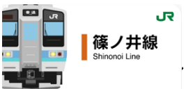
篠ノ井線スタンプ帳ラベル