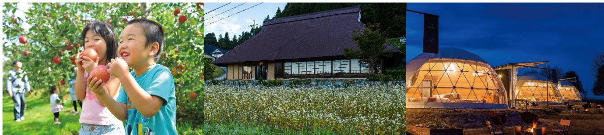
築250年の歴史ある古民家（一棟貸し） 国営備北丘陵公園内にあるグランピング