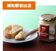
川越芋バター 【川越開運堂株式会社】