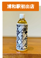
河越茶ペットボトル 【株式会社 十吉(じっきち)】