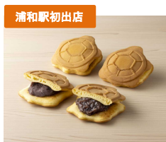
亀どら 【株式会社 亀屋】