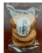
フライせんべい (大玉や) 【埼玉県物産観光館 そびあ】