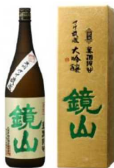
鏡山 さけ武蔵大吟醸 720ml 【小江戸鏡山酒造株式会社】