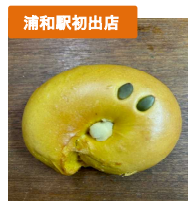
川越ベーグル 【バントイベーグル 蔵造り本店】