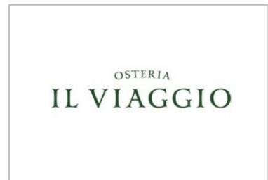
【ショップロゴデザイン】