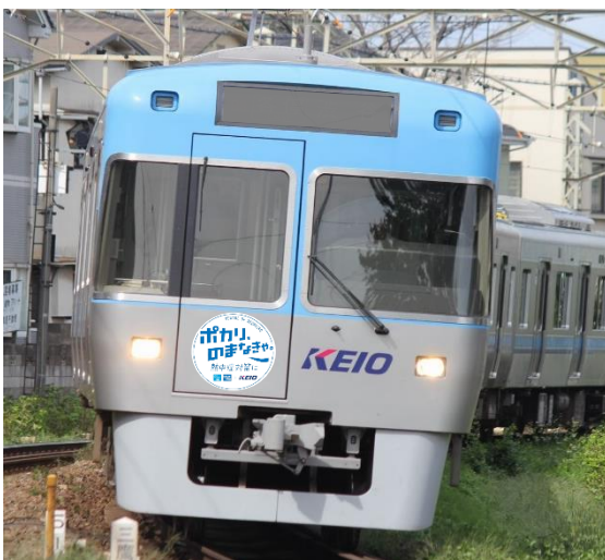
《ポカリトレインイメージ》