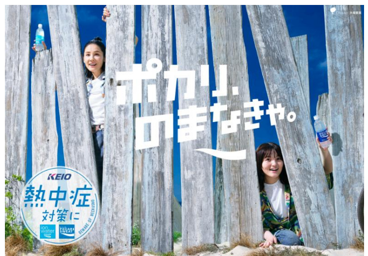
《タイアップポスターイメージ》