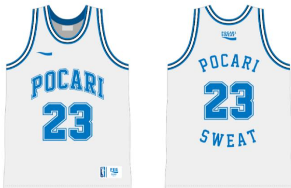
《オリジナルシャツ》

下北沢エリアで活躍する約100名のプレイヤーがオリジナルシャツを着用のうえ熱中症対策を啓発する特別映像を駅・ミカン下北のデジタルサイネージで放映するほか、ミカン下北大階段前にはミストを設置し、ポカリスエットの意匠を凝らした清涼感のある休憩処が期間限定で出現します。