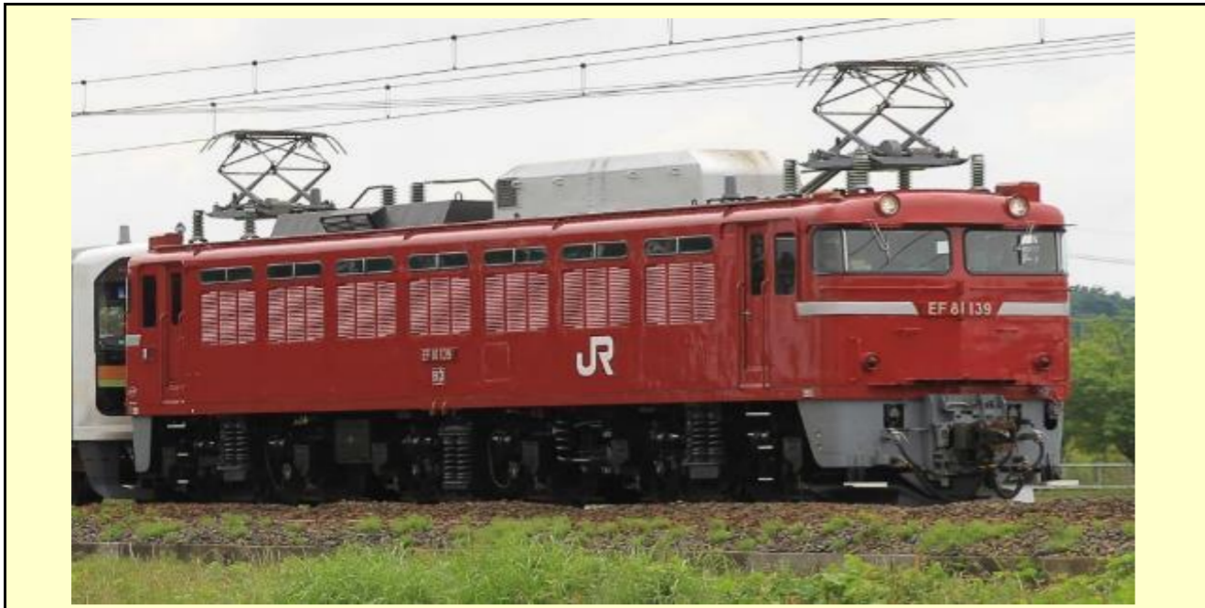
※写真はイメージです 実際の製品仕様と異なる場合があります