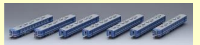
12系 高崎車両センター