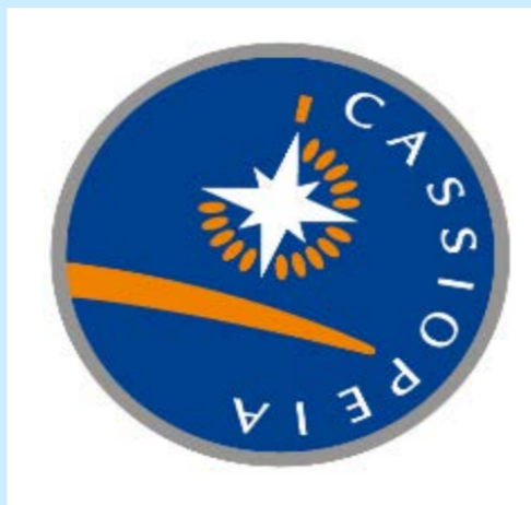
各画像は実車ならびに試作、開発中のものです 実際の製品仕様とは異なる場合があります