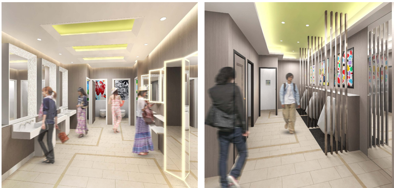
3階トイレリニューアルパース（左：女性、右：男性）

リニューアルフロア3階のお客さま用トイレは、女性トイレのパウダーコーナー、手洗い、ブースが、フレームで仕切られあなただけの特別感の感じられる設計とし、使いやすく快適なトイレであることはもちろん、落ち着いた中に鮮やかさと斬新なデザインを取り入れた空間となります。また、女性トイレには「Afternoon Tea LIVING ReMIX」で商品として取り扱っているアロマを常時設置いたします。