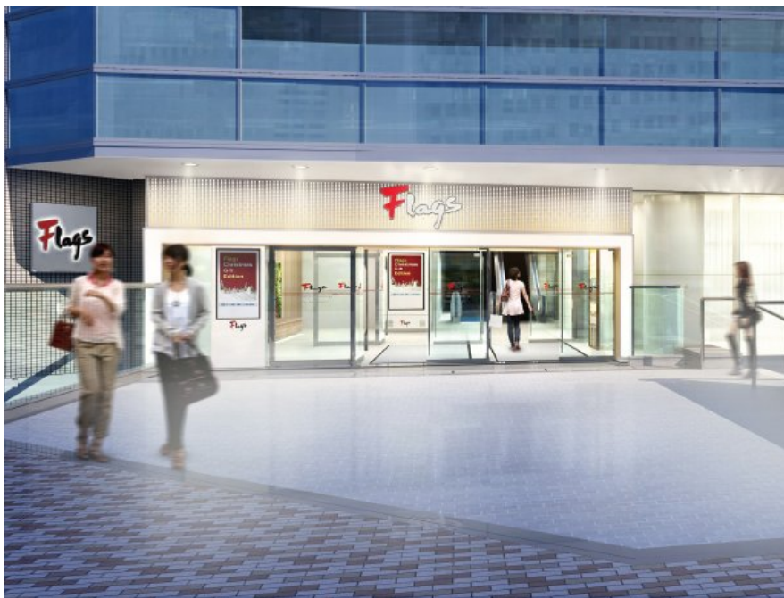
2階エントランスパース

Flags(フラッグス)2階、3階のリニューアルオープンの概要は、下記のとおりです。