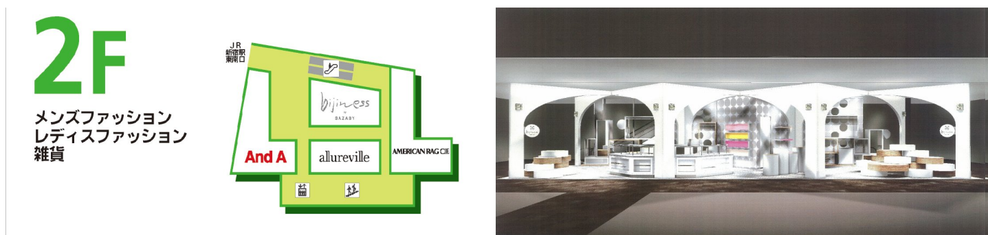
左: 2階フロアマップ、右: bijniness by SAZABYパース