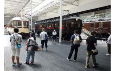
過去のツアーの様子