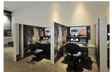
在来線シミュレータ「運転」