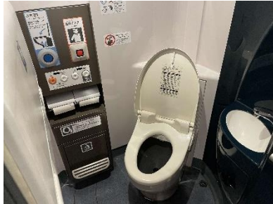
東海道新幹線 洋式便所