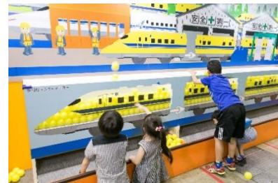
写真 ii）車両に色をつけよう！

JR東海承認済 JR西日本商品化許諾済 黄色いボールを入れて、ドクターイエローを完成させよう！