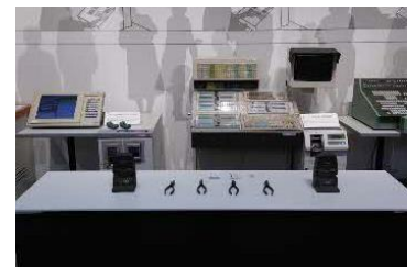
イベント開催場所の様子