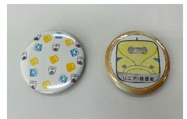
オリジナルバッジの制作例