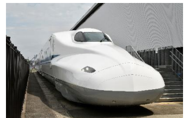
屋外展示 N700系新幹線電車