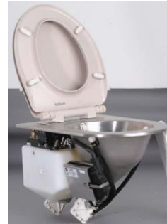
鉄道用真空式トイレ