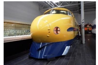
922形新幹線電気軌道総合試験車 (ドクターイエロー)