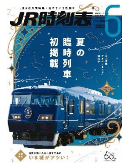
JR時刻表 (イメージ) ※交通新聞社発行