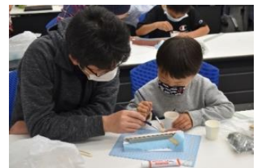
ジオラマ制作の様子