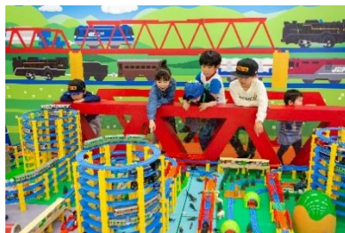
写真 i）ガタンゴトン鉄橋をわたろう！