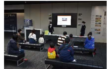
過去のお仕事紹介の様子

「リニア・鉄道館」のホームページでもご案内しています。 (https://museum.jr-central.co.jp/)