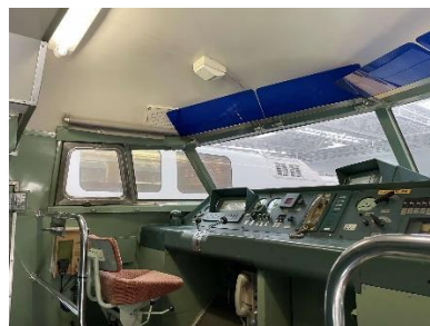
ドクターイエロー（922形）の 運転台の様子