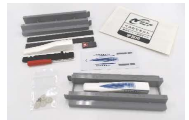
超電導リニアの模型 ※写真はキット2つ分です