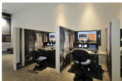
在来線シミュレータ「運転」

「リニア・鉄道館」のホームページでもご案内しています。 (https://museum.jr-central.co.jp/)