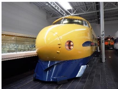
922形新幹線電気軌道総合試験車 （ドクターイエロー）