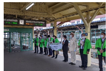
※写真は全て昨年の様子

釧路駅にて、釧路市内にある観光・宿泊施設の関係者によるお見送りを予定しております。