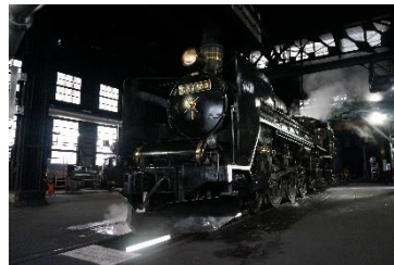
SL 検修庫・C57 180