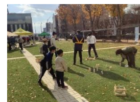
モルック体験の様子

※受付はありませんので、参加する方は会場にいるスタッフにお声がけください。 ※体験は無料です。