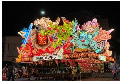
ねぶた制作：竹浪 比呂央