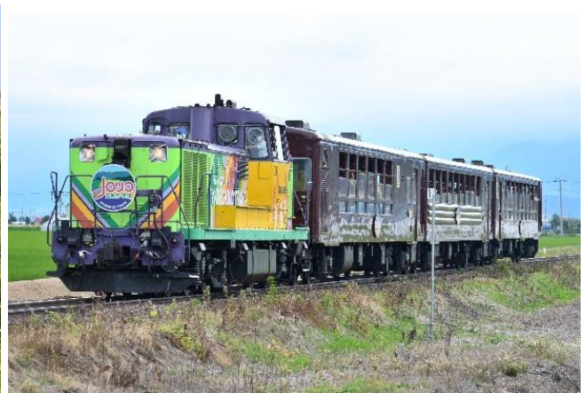
富良野・美瑛ノロッコ号