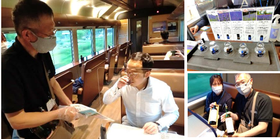
2022 年度開催時の様子（イメージ）