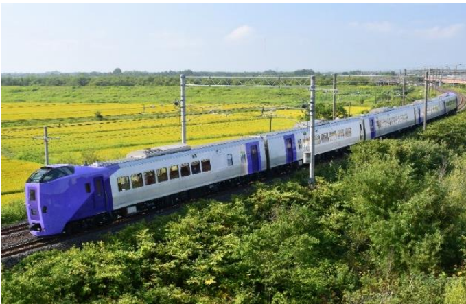
特急フラノラベンダーエクスプレス

ぜひこの機会に、季節を彩る観光列車に乗って、富良野・美瑛でのひとときをお楽しみください。