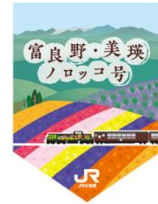
歓迎フラッグイメージ →

※車内装飾は、各号車によって仕様が異なります。 ※天井装飾は、3号車（指定席）のみとなります。