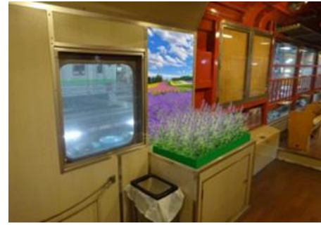
(1号車自由席 フラワーBOX イメージ)