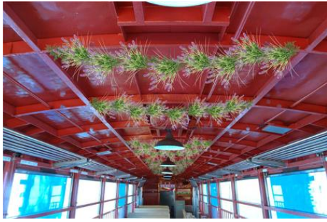
(3号車指定席 天井装飾イメージ)