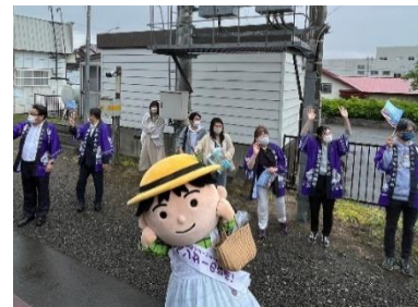
2022年度開催時の様子（イメージ）