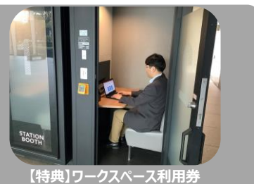
【特典】ワークスペース利用券

※旅行のスタイルに合わせて「列車と宿泊」を自由に組み合わせられる「JR 東日本びゅうダイナミックレールパック」の予約サイトにおいてクーポンを使用してお得にご利用いただけます。ワークスペース利用券は、JR 東日本が展開する「STATION BOOTH」が利用対象となり、会員登録を行うと予約してご利用いただけます。