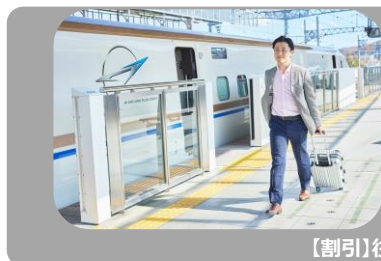
【割引】往復列車+宿泊