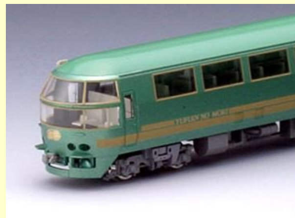
キハ70・71形 ゆふいの森/世