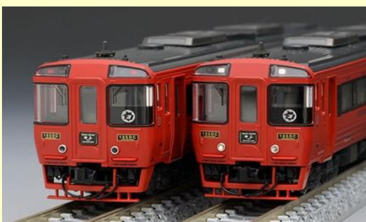
キハ185系 アラウンド・ザ・九州