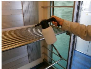
車内の消毒作業 (スカイライナー)