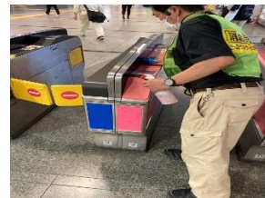
駅構内の消毒作業