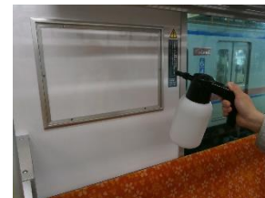
車内の消毒作業 (一般車両)

なお、国の新型コロナウイルス感染症対策本部からは、混雑した列車内ではマスク着用が推奨(スカイライナーのような着席車両は推奨対象外)されておりますが、着用の要否については、お客様ご自身でご判断いただきます。