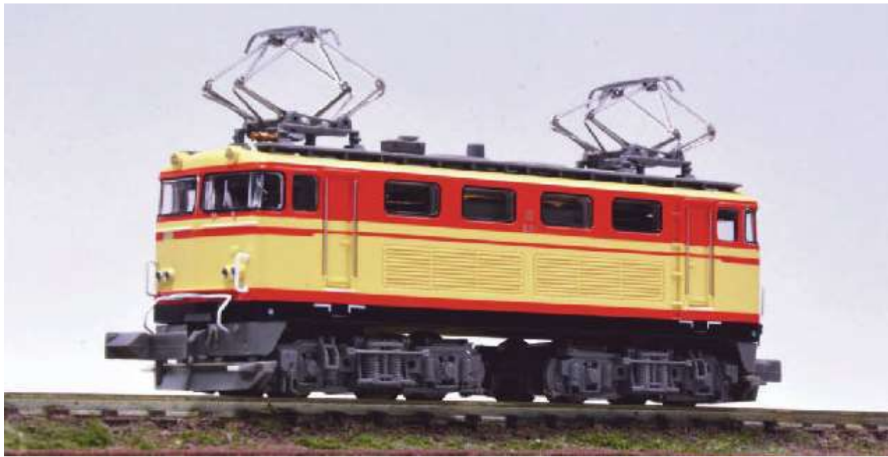
西武鉄道株式会社商品化許諾済