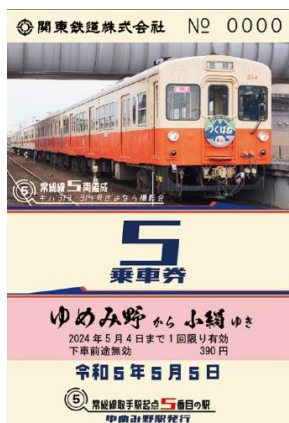
常総線（ゆめみ野～小絹）