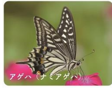
アゲハ (ナミアゲハ)