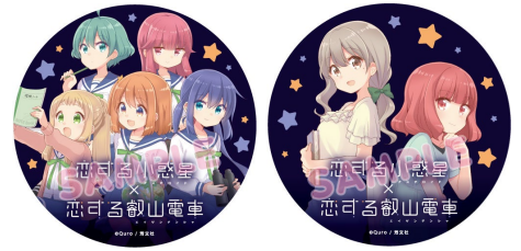
コラボヘッドマークのイメージ

※運転時間は日によって異なります。また、車両点検やその他の理由により運休や運行期間終了日を変更することがありますのであらかじめご了承ください。