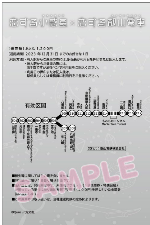
コラボきっぷのイメージ