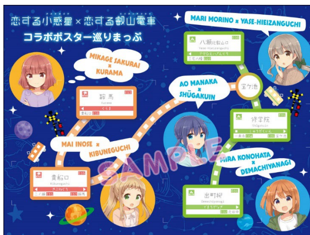
特典台紙（コラボポスター巡りまっぶ）のイメージ