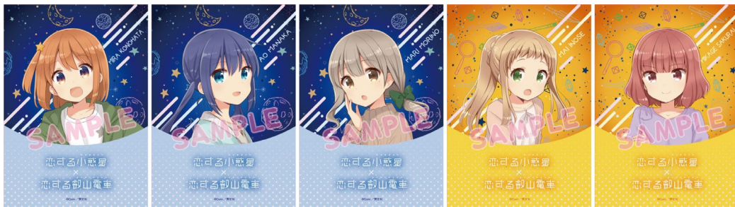
コラボポスターのイメージ