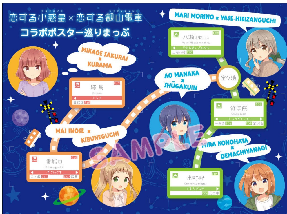
特典台紙（コラボポスター巡りまっぷ）のイメージ