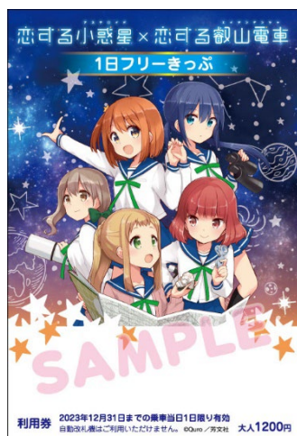
コラボきっぷのイメージ