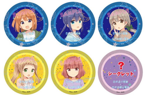
コラボ缶バッジのイメージ