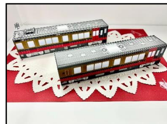
<ペーパークラフトイメージ>