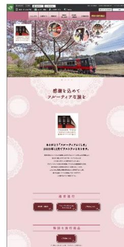
<専用ホームページイメージ>

●URL： https://www.jreast.co.jp/sendai/thankyou_fruitea/