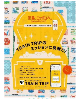
(ミッション告知のポスター)