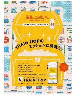
(ミッション告知のポスター)