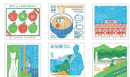
（追加するスタンプの一例）

4月28日（金）に、120個の新スタンプを追加します。新スタンプの対象駅は、これまでスタンプが無かった駅も、既にスタンプがある駅でデザインをリニューアルする駅もございます。新スタンプの対象駅はWEBアプリ内でご確認ください。