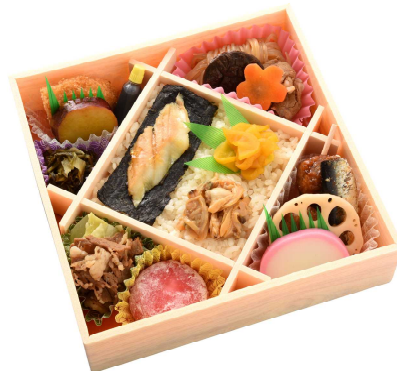
上野駅開業140周年記念