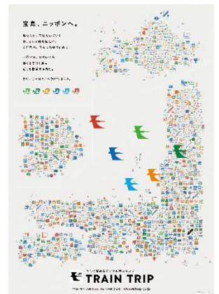
（キャンペーンポスター）