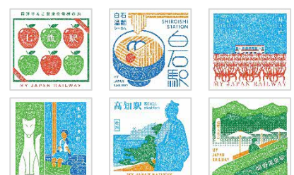
（追加するスタンプの一例）

4月28日（金）に、120個の新スタンプを追加します。新スタンプの対象駅は、これまでスタンプが無かった駅も、既にスタンプがある駅でデザインをリニューアルする駅もございます。新スタンプの対象駅はWEBアプリ内でご確認ください。