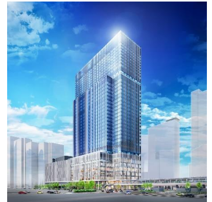
建物外観イメージ（JR大阪駅前から）