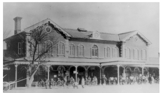
初代大阪駅の駅舎

こうした歴史的な意義を踏まえ、鉄道の記憶と、先人たちの想いととも、150年の歳月を経て、初代大阪駅の地に、お客様をお迎えできる喜びと、紡がれてきた歴史や文化、その価値を未来へ継承しながら、ホテルのあるべき姿を追求し続けたいと、当ホテルを「大阪ステーションホテル」と命名しました。