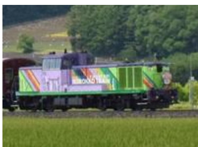
ラベンダー色のDL機関車