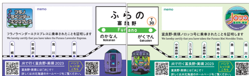
▲裏面は、富良野・美瑛ノロッコ号の乗車証明書と繋がるデザイン！