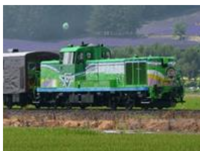
グリーン色のDL機関車