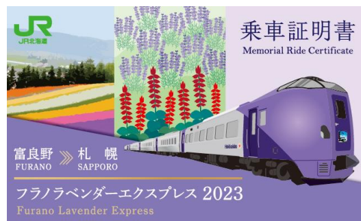
▲乗車証明書デザイン (左：下り、右：上り)