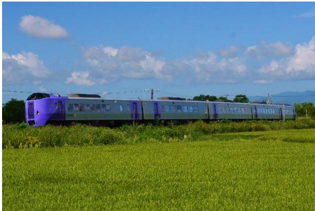
特急フラノラベンダーエクスプレス