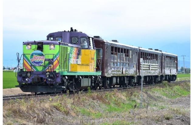
富良野・美瑛ノロッコ号