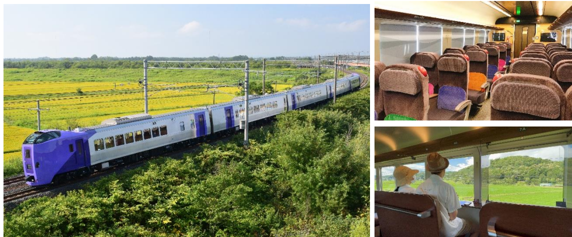
261系5000代「ラベンダー」編成(イメージ)

札幌と富良野を結ぶ便利なアクセス列車を、今年も「ラベンダー」編成で運転します。「ラベンダー」編成は、全車両Wi-Fi完備・全座席コンセント利用可能で移動時間まで有効に活用できるほか、1号車「ラベンダーラウンジ」をフリースペースとしてご利用いただけます。