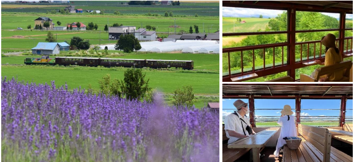
富良野・美瑛ノロッコ号（イメージ）

田畑の中をのんびり走るトロッコ列車です。車窓の見どころでは、速度を落として運転します。季節ごとに変わる車窓をお楽しみください。