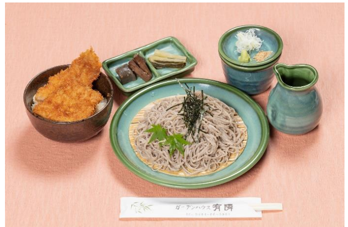
人気メニュー「ざるそばと小わらじかつ丼のセット」 イメージ