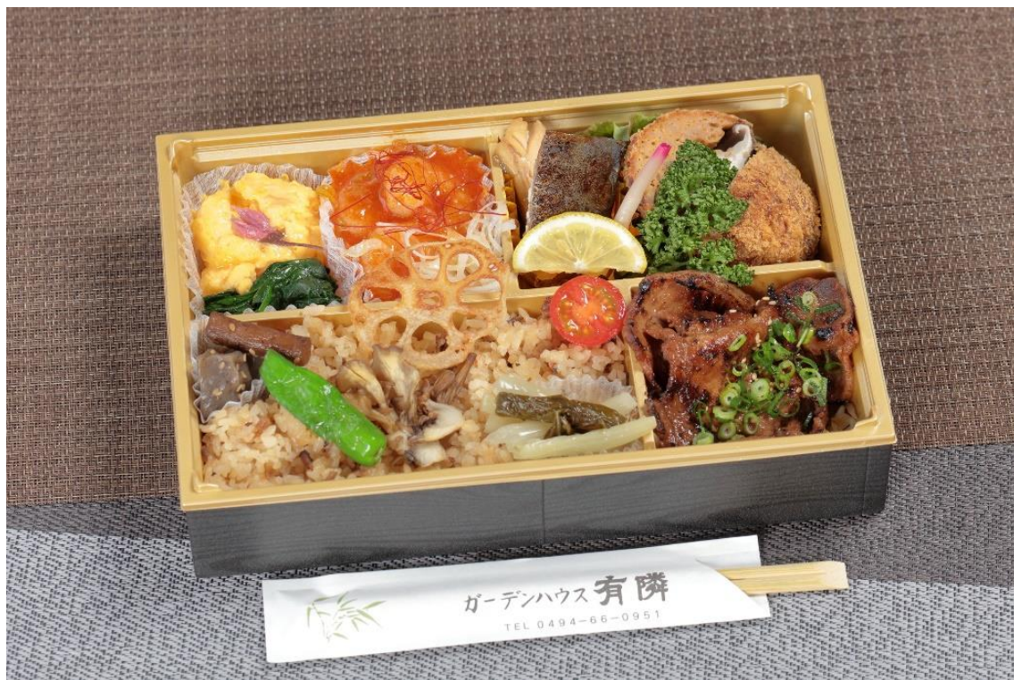
いろどりの秩父路 イメージ

地場の野菜や食材をふんだんに取り入れた SL パレオエクスプレスオリジナルの和食弁当です。お弁当中央のレンコンの素揚げは、SL の動輪をイメージし、お酒のつまみにもなるように少しづついろんなメニューを詰め込みました。ゆっくりと進む SL パレオエクスプレスの車内でお楽しみください。