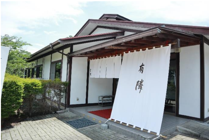
ガーデンハウス有隣 イメージ

ガーデンハウス有隣は、宝登山山頂や寶登山神社など散策の途中に、気軽に立ち寄れるお食事処です。地場の食材を使用したそば・うどんを中心としたメニューの他、秩父名物の「炙り豚みそ重」や「わらじかつ丼」などリーズナブルなお値段でお楽しみいただけます。