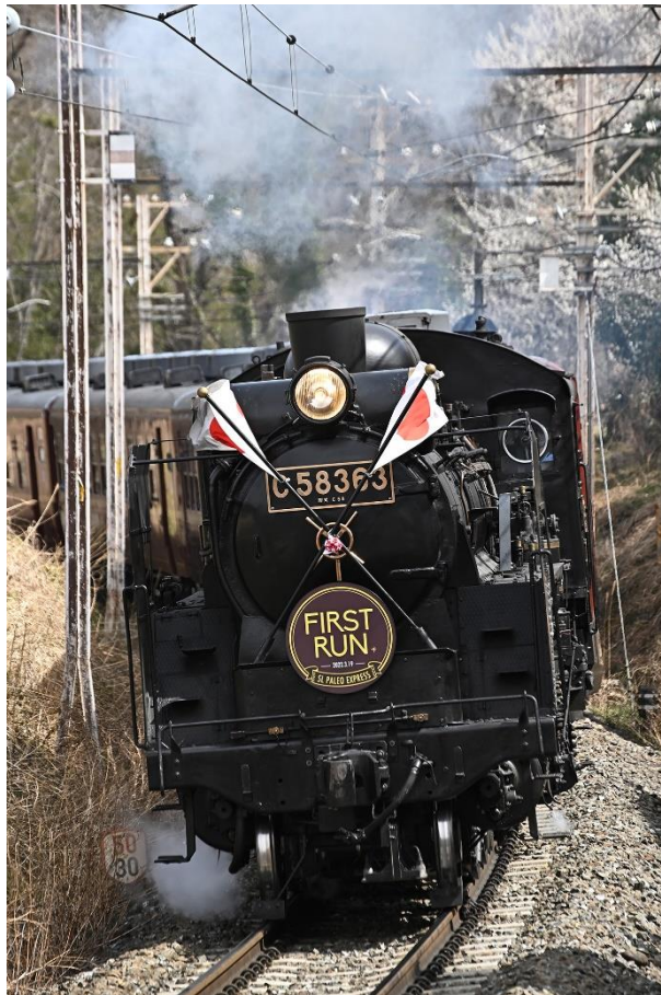
SLパレオエクスプレス イメージ