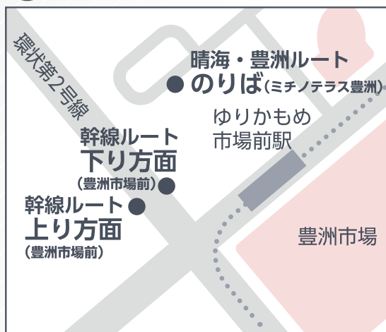
B03 豊洲市場前 (ミチノテラス豊洲)