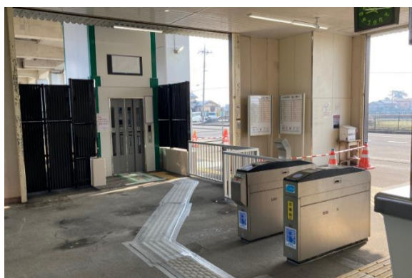
【エレベーター改札階外観】