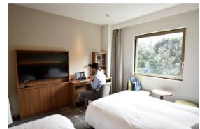
▲ホテルメッツ目白