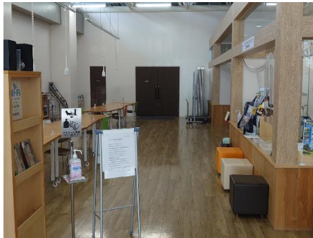
▲フリースペース（左側）、受付ロビー（右側）