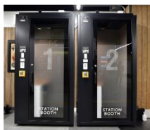
▲ STATION BOOTH