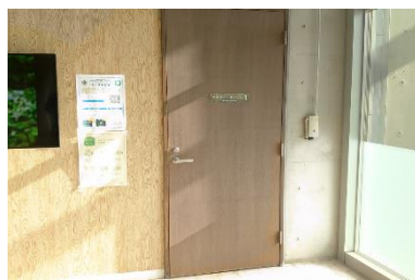
▲サテライトオフィス（入口）