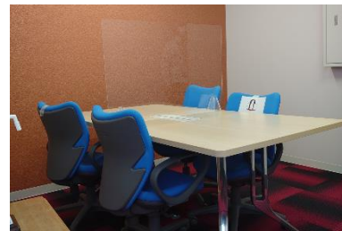
▲サテライトオフィス内