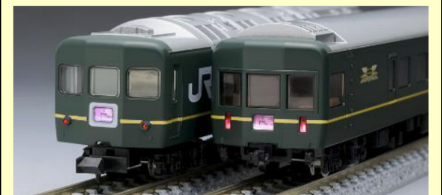
トワイライトエクスプレス