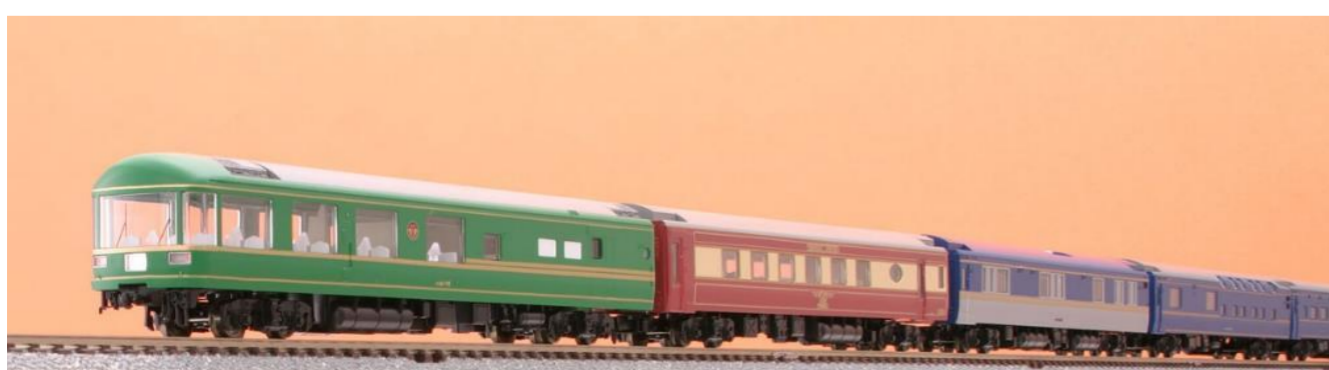
JR 24系25形特急寝台客車(夢空間北斗星)