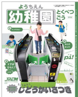
▼ 参加記念品の一例

参加記念品：先着 400 名さまには JR 東日本メカトロニクス(株)提供、小学館「幼稚園」特別号 (改札機工作キット付録付き)、それ以降は交通系 IC カードのキャラクターグッズや鉄道グッズなどから、お一人さまおひとつプレゼントします。