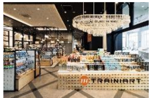
▲ TRAINIART (トレニアート) 店内