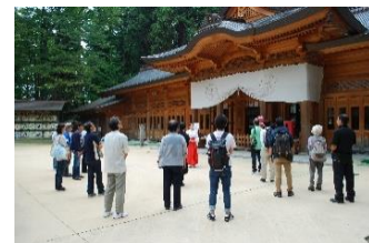
穂高神社の参拝案内

土休日を中心に巫女さんや地元のボランティアガイドによる穂高神社への参拝をご案内いたします。