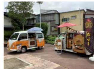
富士見駅前のキッチンカー