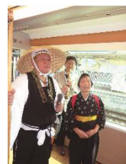
車内でのおもてなし