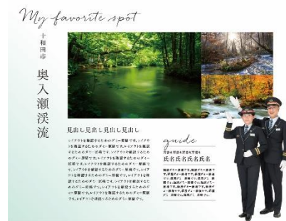
【写真展(出演者掲載イメージ)】