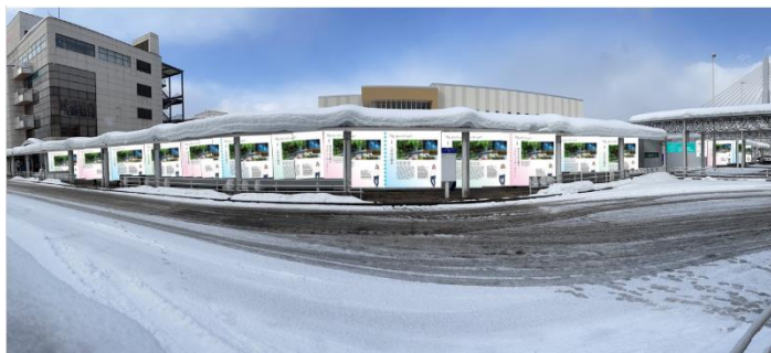
【写真展(全体図イメージ)】

青森の未来を担う方や地域の盛り上げにお力を貸していただけの方など全17組が参加し、各々がプレゼンターとなって、未来に残したい・語り継ぎたい青森県内のお気に入りの場所やモノなど、写真により魅力発信します。