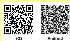
ダウンロード用QRコード