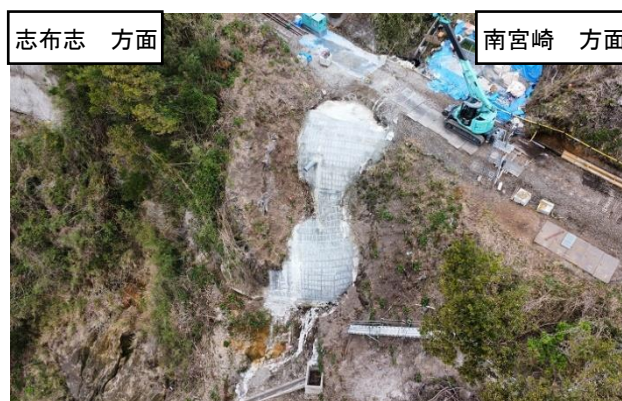
日南線 大隅夏井駅～志布志駅間 築堤崩壊現場 (左：被災後(2022年9月26日撮影)、右：現在(2023年2月18日撮影))