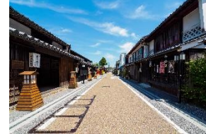
城東町並み保存地区