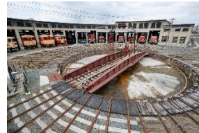
津山まなびの鉄道館