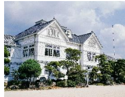
旧遷喬尋常小学校