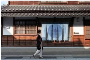
勝山町並み保存地区