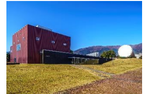
奈義町現代美術館