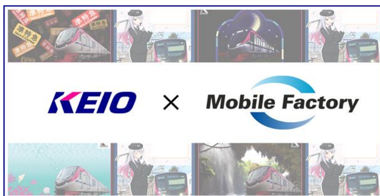
《ビジュアルイメージ》