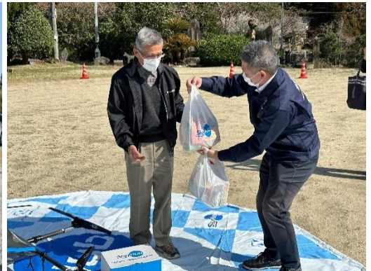
ドローン配送された健康食品セットを 受け取る地域住民モニター （高山区民会館にて）