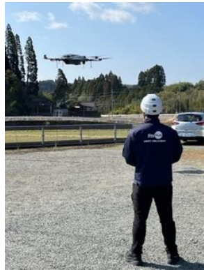
日置市高山地区で荷物を配送する 物流専用ドローン“AirTruck”